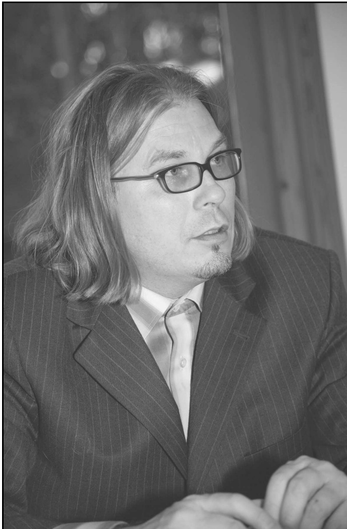
Kirjoittaja on Miessakit ry:n valtuuston jäsen ja itsenäisen miesliikkeen aktiivinen puolestapuhuja.

heenaiheet, jokainen julkaisutilanne nostaa kapinan Tampereen yliopistossa. Se on vakuutettu Unioni Naisliiton kanteita vastaan.